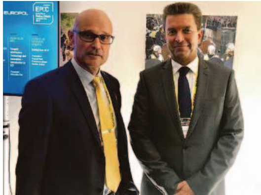
Polizeichef Jules Hoch (l.) zusammen mit dem Luxemburger Polizeichef Philippe Schrantz.

Holland Am Europäischen Polizeichef-Treffen (EPCC) bei Europol in Den Haag (Holland) wurde diese Woche die Rolle der Sicherheitsbehörden bei der Bewältigung der Migrationsprobleme in Europa ebenso diskutiert wie die aktuellen Erwartungen der Mitgliedsländer an Europol. Weitere Themen am Treffen waren die aktuellen Bedrohungen in den Bereichen Cybercrime sowie Radikalisierung und Terrorismus. Polizeichef Jules Hoch vertrat die Landespolizei beim EPCC und nutzte die Gelegenheit auch für bilaterale Gespräche mit Kollegen. (lpfl)